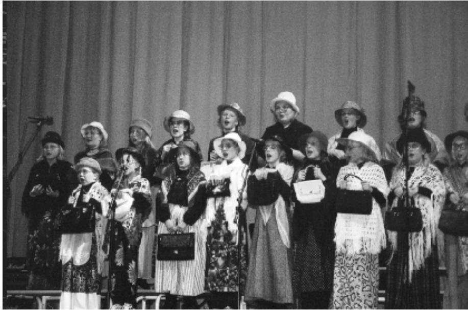
Skolmusik 2000: "Tusen blommor blommor" i ishallen i Helsingfors. Singsing sjunger "Gamla kärringar".

Jag tycker att det är underbart att man inom Svenskfinland ordnar sådana här projekt, så att unga talanger kan komma fram och visa vad de går för.